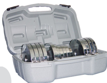
Valigetta porta pesi di prova.