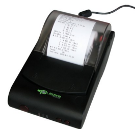
Micro-stampante esterna (opzionale)