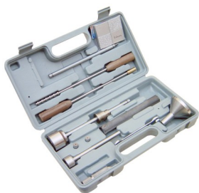
Valigetta contenente l'ugello, l'imbuto di caricamento del materiale e i vari attrezzi di pulizia dello strumento.